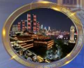
มื้อค่ำร้านอาหารวิหคัลักล้าน