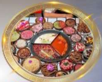
บุฟเฟต์หน่อโพลงซิ่ง