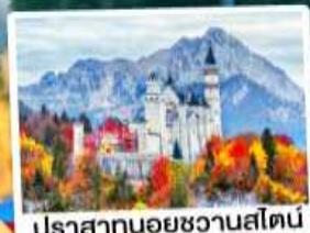
ปราสาทน้อยชวานส์ไตน์