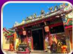
ศาลเจ้าแม่ลิ้มกอเหนี่ยว

ที่เที่ยวเพิ่มขึ้น และ ช่วยฟื้นฟูเศรษฐกิจขนาดใหญ่