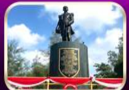
อนุสาวรีย์กรมหลวงชุมพรฯ