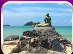
เที่ยวหาดสมิหลา สงขลา